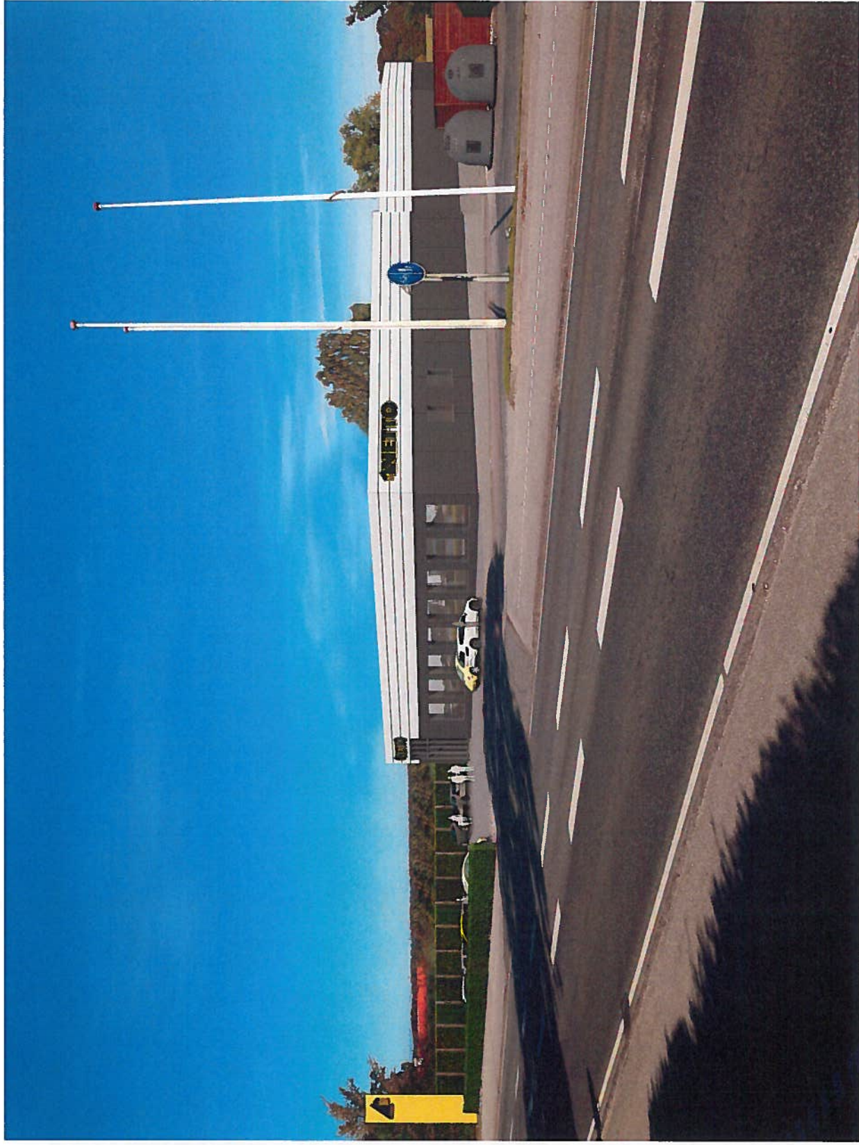
Hillerødvej, Kregme Fremtidige forhold